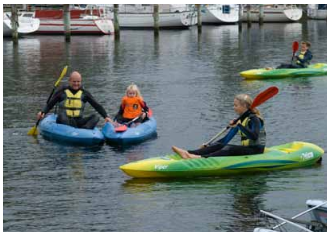
FAMILIEDAG I DANMARK (FRA VALLENSBÆK HAVN)

Samtidig med fokus på individuel støtte, sundhed og team fremmende aktiviteter, er det vigtigt at der også tænkes på familierne bag TORM medarbejderen. Derfor yder Fonden støtte til feriemuligheder og til medarbejderforeningers afholdelse af familiedage, som samler medarbejdere og deres familie om aktiviteter og fælles oplevelser.