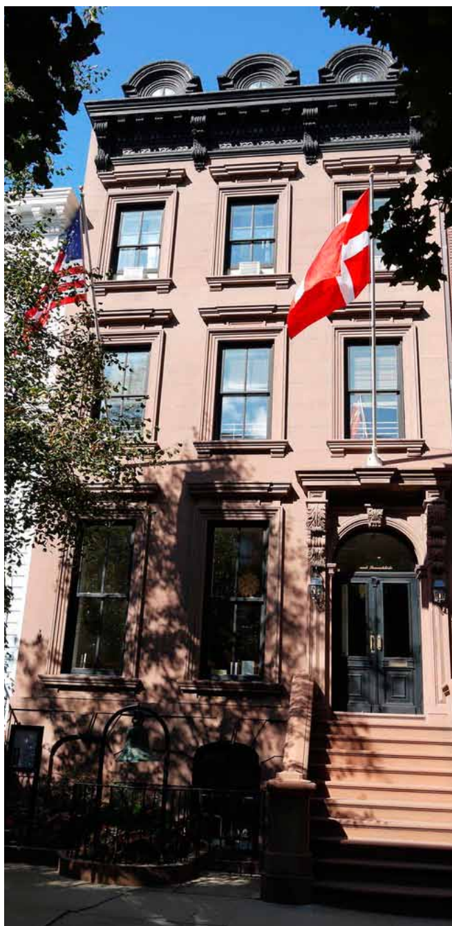
SØMANDSKIRKEN I NEWYORK