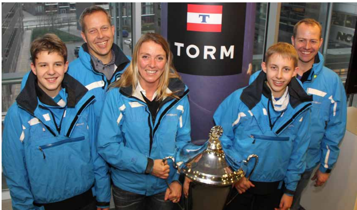
SOLBJERG SØSPORT, (TORM PRIS – SÆRLIG INDSATS), FOTO: CHRISTIAN M. BORCH/DANSK SEJLUNION