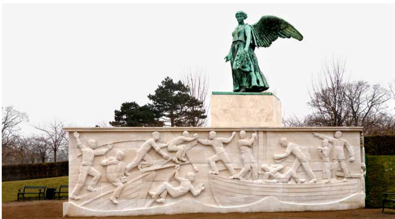
RENOVERING AF SØFARTSMONUMENTET PÅ LANGELINIE.

Det er bl.a. sket gennem støtte til Danmarks Indsamlingen , som dækker bredt og videre formidler til en lang række humanitære organisationer, der i 2011 havde særligt fokus på støtte til unge i Afrika. Derudover støttede Fonden også i 2011 til Red Barnets projekter i Somalia for at give børn og unge mulighed for at uddanne sig og vise, at der er andre og gode måder at skabe sig en fremtid i Somalia.